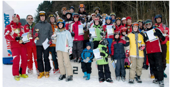
Die PreisträgerInnen beim Schirennen 2010 am Maiswaldlift in Riegers

Für das leibliche Wohl der Rennläufer und der vielen Zuschauern sorgte die FF Riegers und die Jausenstation Rosenmaier.